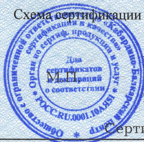
Схема сертификации № 1с.